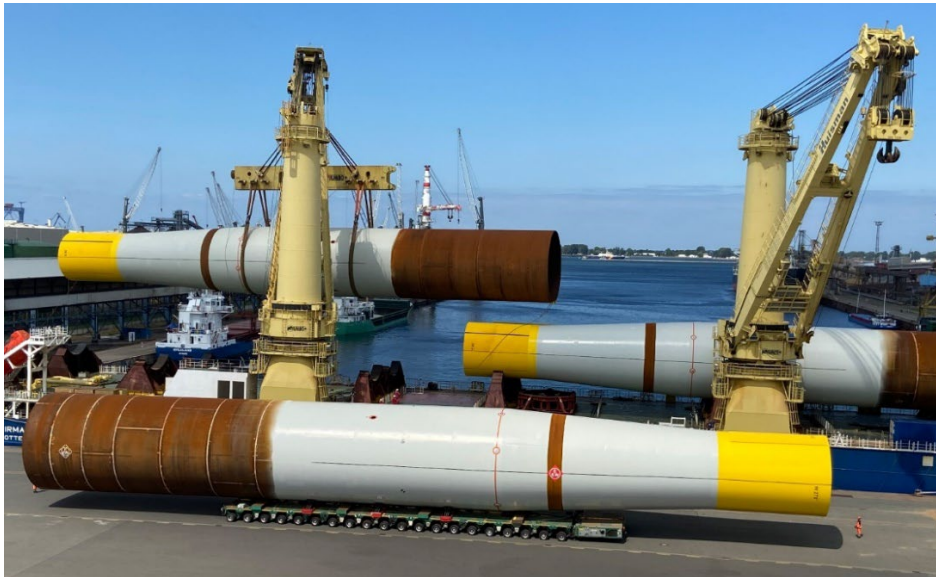
Abbildung 2: Monopile während der Verladung am Kai von EEW SPC in Rostock, Deutschland